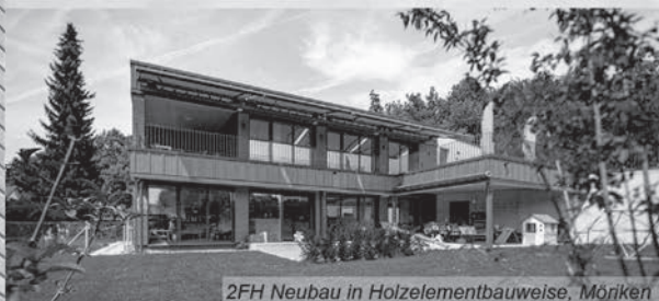
2FH Neubau in Holzelementbauweise, Mörken

Nachhaltige und klima- schonende Architektur. Kontaktieren Sie uns... ...wir freuen uns auf Sie.